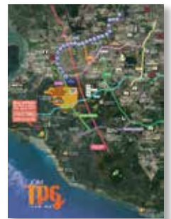
'Big Picture' #JOMTPG