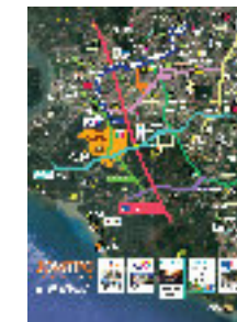
'BIG PICTURE' #JOMTPG